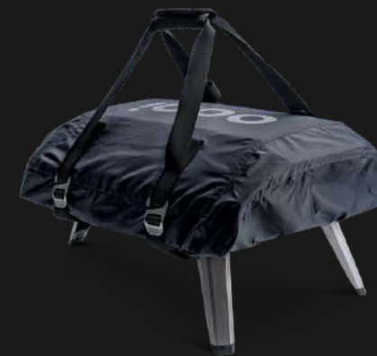
KODA 12 COVER