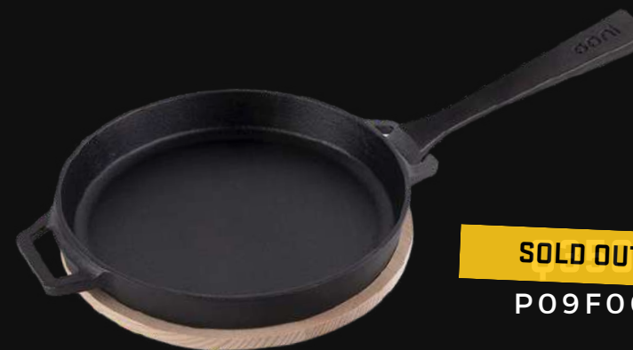
SOLD OUT P09F00