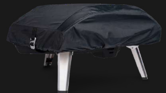
KODA 16 COVER